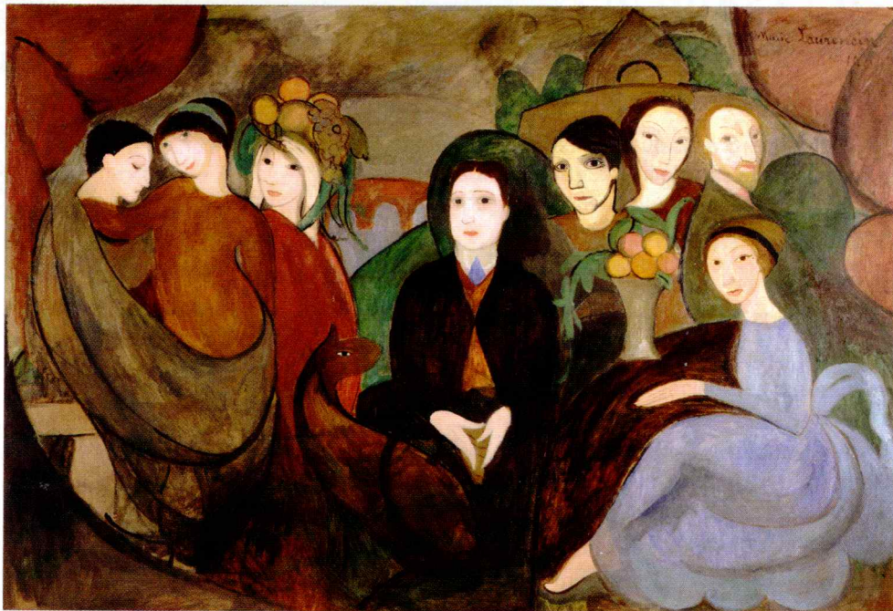
▲ Marie Laurencin (1883-1956), Le Poète Guillaume Apollinaire et ses amis (1909), huile sur toile, 1,30 x 1,94 m (musée national d'Art moderne, centre Georges-Pompidou, Paris).

Les femmes poètes du début du xx e siècle font renaître le courant romantique: Anna de Noailles (► p. 252) chante la beauté du monde. Guillaume Apollinaire (► p. 247) ouvre la voie de la modernité , notamment par l'utilisation du vers libre, la suppression de la ponctuation, le renouvellement des images (évoquant le monde urbain: tour Eiffel, ponts de Paris...). En 1924, André Breton (1896-1966) fonde le mouvement surréaliste , qui accorde une large place à l'écriture et aux images spontanées. Des poètes comme Louis Aragon (► p. 270) et Paul Eluard (► p. 243, 262) en resteront profondément influencés.