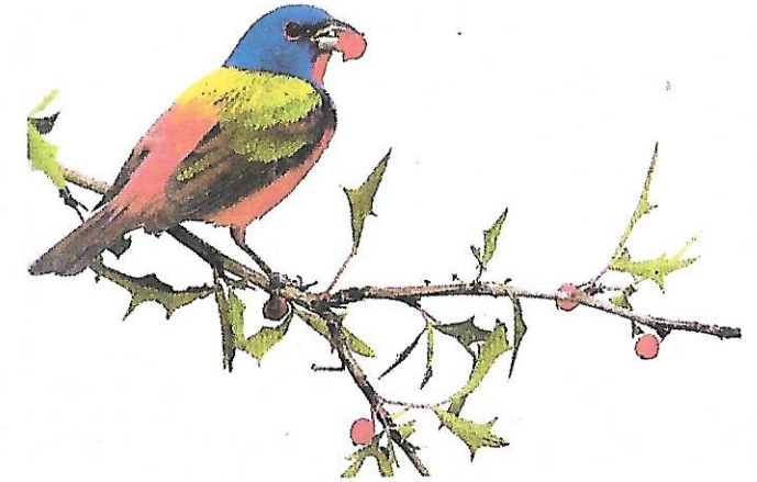
Passerín nonpareil mâle se nourrissant de baies.

En vous appuyant sur l'image, écrivez un poème qui évoquera la beauté de l'oiseau. Votre poème comprendra une dizaine de vers et sera écrit en vers libres (les vers sont disposés en strophes mais ils ne riment pas et il n'y a pas nécessairement le même nombre de syllabes dans chaque vers).